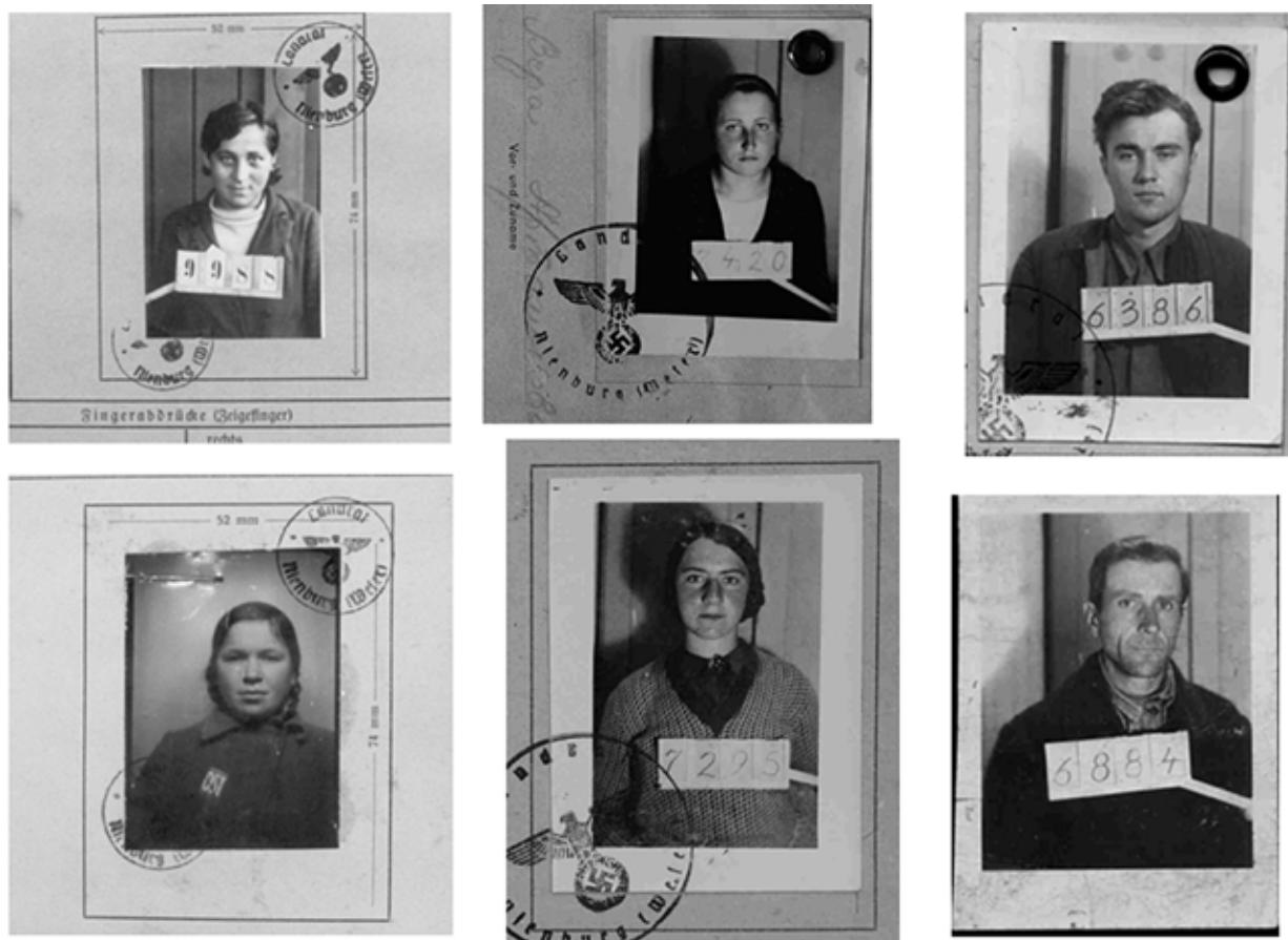
Принудительные рабочие на пороховой фабрике Либенау.

На сегодняшний день в Либенау еще нет мемориала и образовательного центра с регулярными продолжительными выставками, однако начаты соответствующие планирования по перестройке в этих целях одной пустующей части школы в Либенау, поскольку это учреждение образования было построено в 1960-х годах на месте бывшего Рабочего воспитательного лагеря Либенау. Планируется, что после создания такого центра там будет проводиться исследовательская работа, проходить различные мероприятия, выставки, а также международные молодежные обмены по теме принудительного труда на