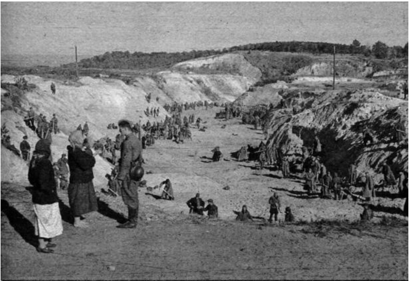
Babi Jar, 29./30. 9. 1941 – Erschießung von 33 771 jüdischen Menschen.