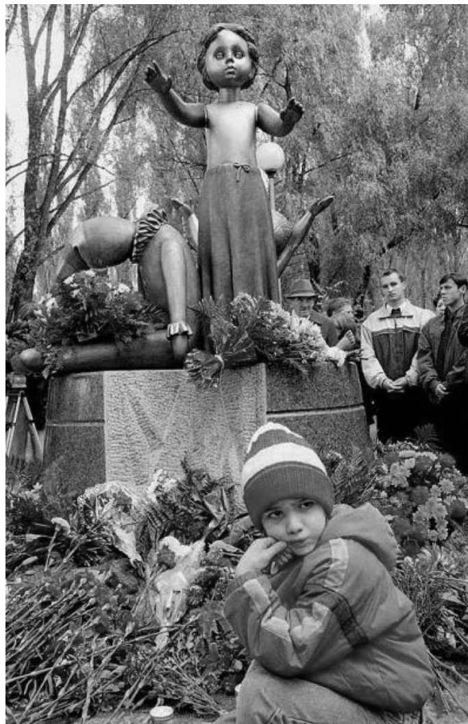
Памятник уничтоженным в Бабьем Яру детям. Установлен 30 сентября 2001 г.

История Бабьего Яра нуждается в нашей общей ответственности. Государство сегодня не запрещает научную, образовательную или общественную деятельность в сфере памяти о Холокосте, но оно и не выступает инициатором таких мероприятий и реально их не поддерживает, хотя вместе с тем почти всегда декларирует эту поддержку. Что красноречиво демонстрирует отсутствие государственной политики памяти о жертвах Второй мировой войны в Украине. Это — вызов историческому сообществу Украины, нашему обществу. Способствовать осознанию трагедии Бабьего Яра как универсального символа, память о котором должна быть сохранена ради лучшего понимания природы тоталитарных режимов и человеческого общества.