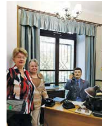
Museum des Innenministeriums