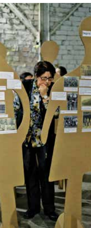
Diskussionsclub Im Herbst 2019 nahmen Freiwillige an der Diskussion im Rahmen der Ausstellung der Gedenkstiftung «Memorial» teil, die den nach Deutschland deportierten Ostarbeitern ge- widmet war.