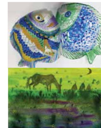
Werke von den älteren Auszu- bildenden der Kreativwerkstatt