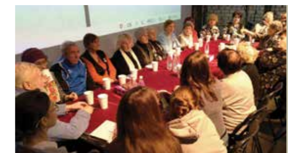
Aktion «Aktives Altern 60+»

Wie die Erfahrung des Projekts zeigt, ist es die Kreativität des Arbeitsansatzes, die die Aufmerksamkeit maximal auf das Leben älterer Menschen lenkt.