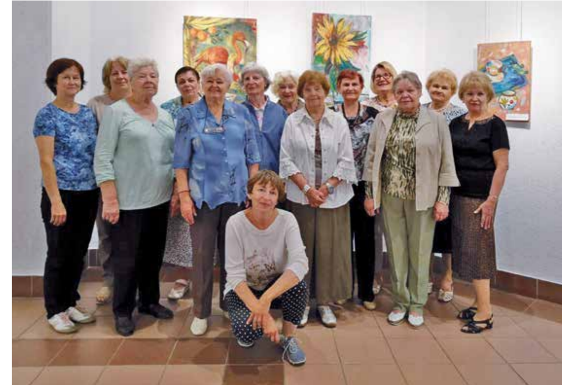
Die Ausstellung in der Kunstgalerie der Kulturuniversität. 2019.

Teilnahme an der Ausstellung eingeladen. Apropos war sie von unseren Werken aufrichtig überrascht. Sie erwartete Kopien von Gemälden vom Internet in einer amateurhaften Aufführung zu sehen, aber sie sah absolut einzigartige Werke der Urheberschaft. Vertreter der Massmedien wurden auch zur Ausstellung eingeladen. Die Amateurlünstlerinnen gaben gerne Interviews und diskutierten über die Bilder in den Medien. Es war auch ein guter Grund, sich schön anzuziehen, festliche Kostüme und Schuhe aus den Schränken zu holen. Und eine großartige Gelegenheit, um Kinder, Enkelkinder, Freunde zu überraschen.