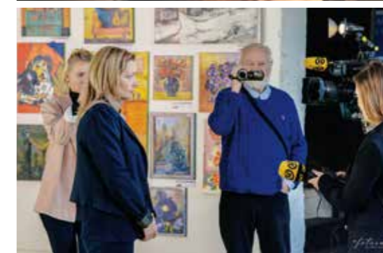
Мероприятие «Активное долголетие 60+»