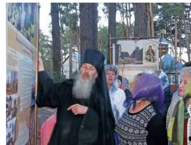
Клуб изучения религий

Клуб изучения религий – 1 раз в 2 два месяца – 20–23 человека. В рамках этого клуба для волонтеров организовывались встречи с представителями разных конфессий Беларуси. Учитывая советское прошлое (государственный атеизм), с одной стороны, и возраст волонтеров, предполагающий осмысление собственной жизни и смерти, с другой стороны, эти встречи для многих стали откровением и утешением. Поэтому в каждой выездной экскурсии всегда было предусмотрено посещение храма и беседа со священнослужителями. Большой интерес вызвали встречи, посещения мечети и синагоги.