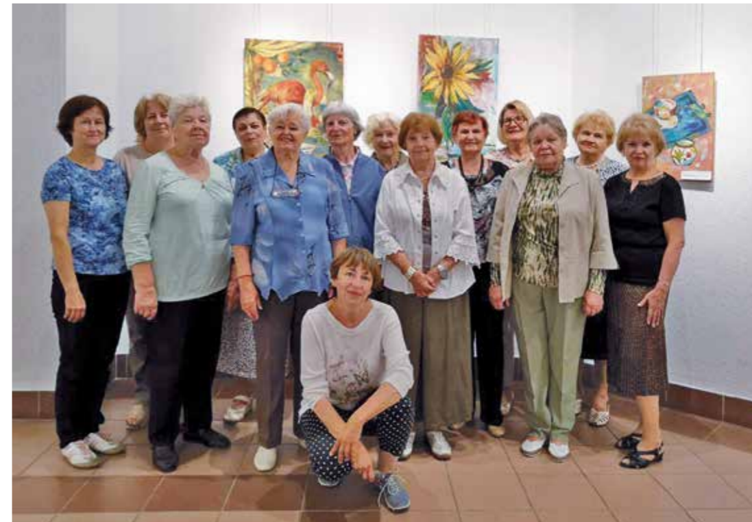
Выставка в галерее Университета культуры. 2019 г.