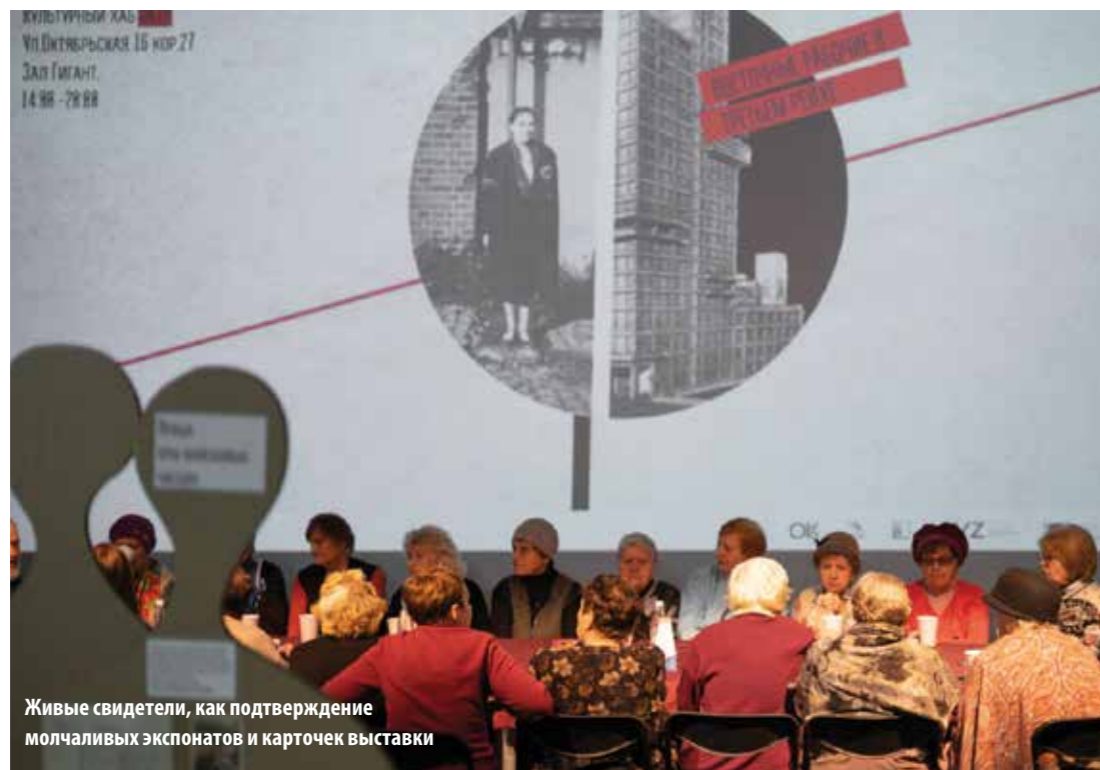
Живые свидетели, как подтверждение молчаливых экспонатов и карточек выставки

Дискуссионный клуб. Осенью 2019 года волонтеры приняли участие в дискуссиях на выставке от фонда «Мемориал», посвященной восточным рабочим, угнанным в Германию.